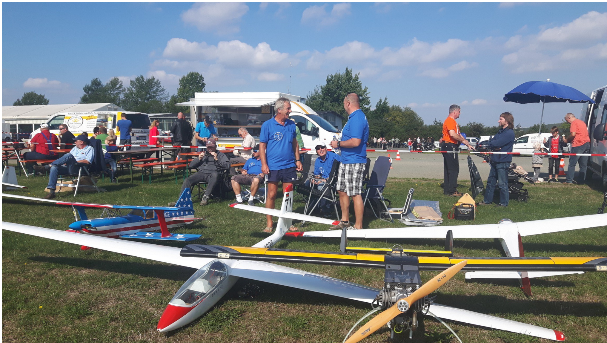
Hier das Jenaer „Fluglager“ und .....