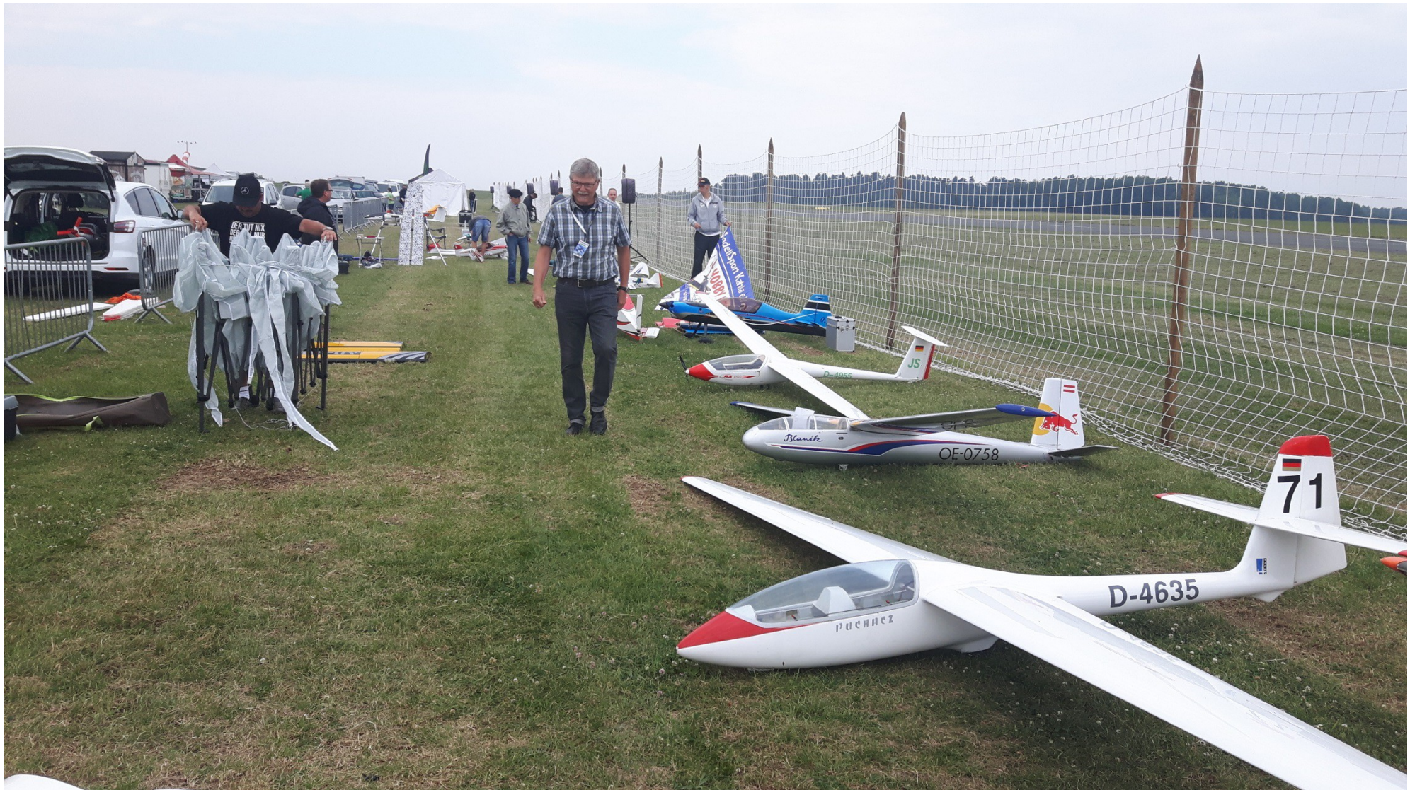
Schaufliegen zu den Thüringer Modelltagen: Die Fieger unserer Piloten!