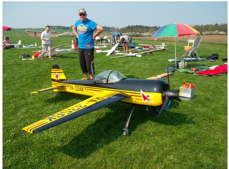
Das nun eine „richtige“ Motormaschine! MOTORFLIEGERTREFFEN MILDA - 2018