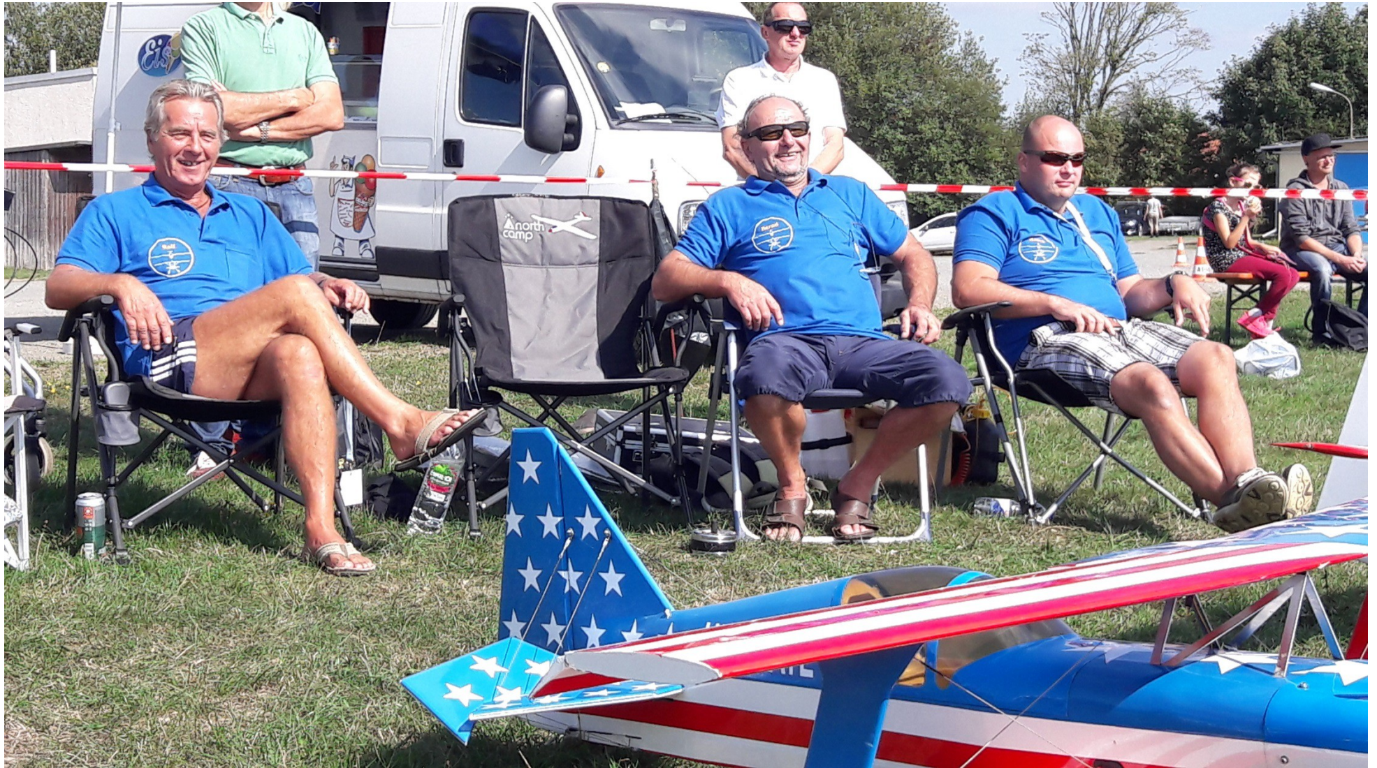
Schausitzen beim Schaufliegen!